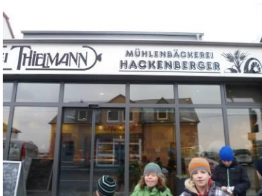
Bäcker / Metzger

Toll, dass es noch solche Geschäfte gibt.