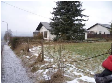
Wiese gegenüber Bürgerhaus

Hier fehlt ein Zaun. Die Lösung mit den Schnüren ist schlecht.